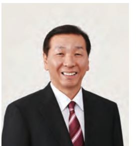
熊本県議会議員 本田ゆうぞう