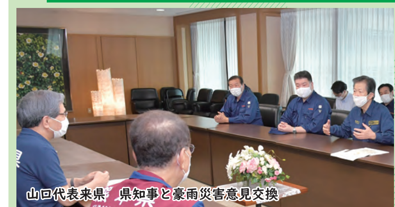
山口代表来県 県知事と豪雨災害意見交換