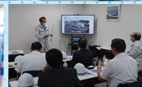
令和4年7月28日 全国の自治体の中でも特に地産地消の観点から再エネ推進に取り組まれている五島市の「ごとうの電気（洋上風力）」及び環境省が進める海洋再エネ（潮流発電）、下関市の最新バイオマス発電所を視察。