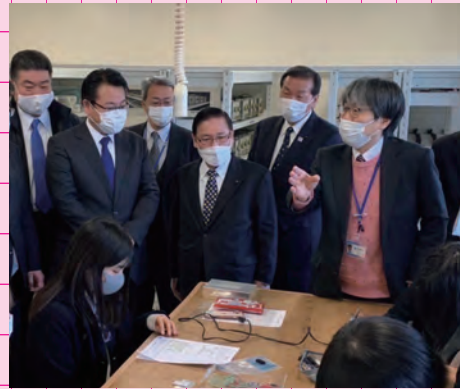
令和4年1月14日 熊本電波高専視察