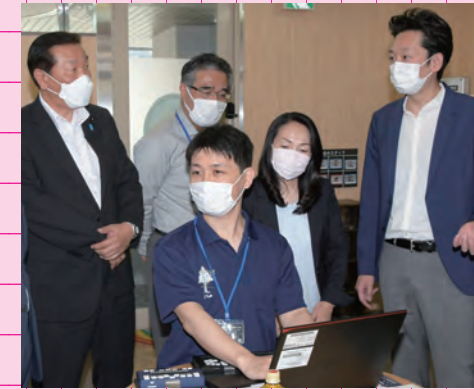
令和4年6月2日 児童発達支援・放課後等デイサービス視察