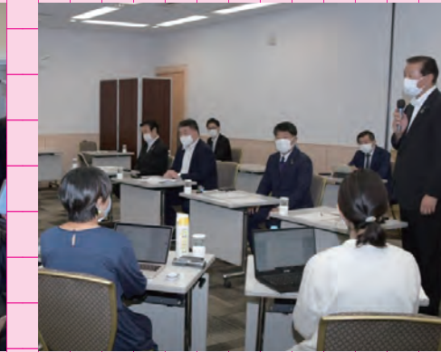
令和3年10月26日 フリースクールに関する意見交換会