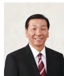
熊本県議会議員 本田ゆうぞう