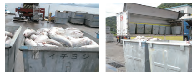
過去に類を見ない高濃度の赤潮被害。水揚げ直前の鯛やブリの被害が多く、早急な支援が必要。