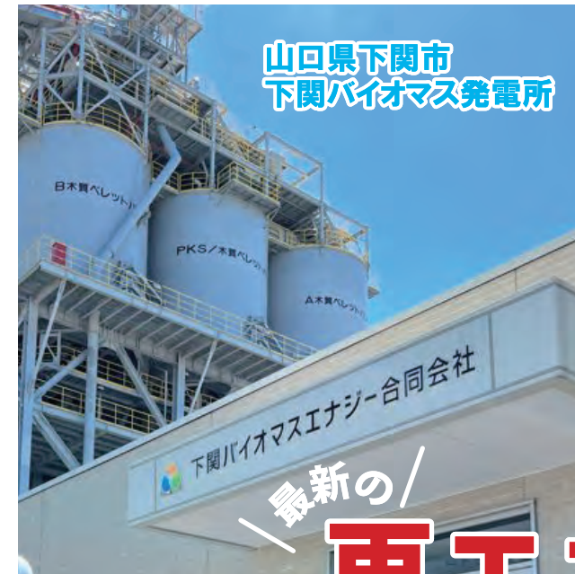
山口県下関市 下関バイオマス発電所