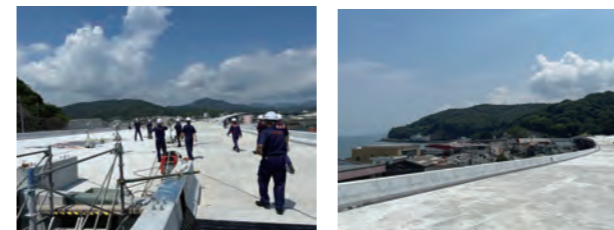
2022.07.26 熊本県議会建設常任委員会視察 本渡道路（第二瀬戸大橋）他