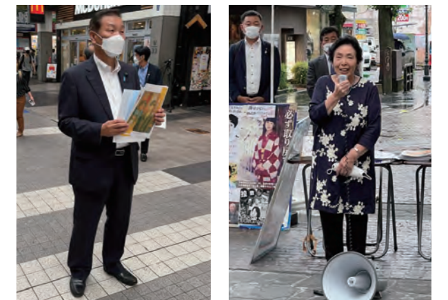
2022.06.13 「北朝鮮に拉致された日本人を救う熊本県議会の会」 街頭署名活動