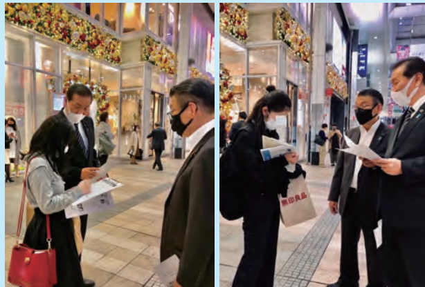
11/15 拉致議連署名活動