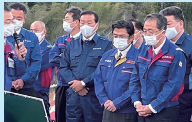
11/27 国土交通大臣豪雨災害復旧状況視察同行