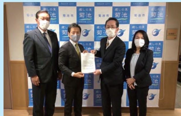
1/22 網膜色素変性症公費助成要望（菊池市長）