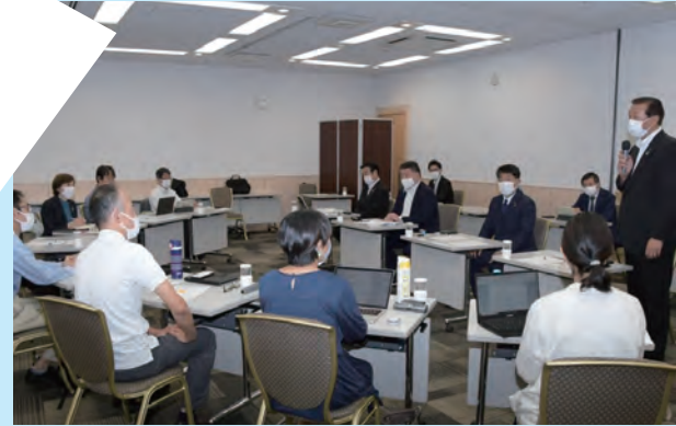
10/26 フリースクールに関する意見交換会